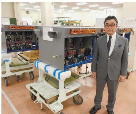
電車車両用「暖流機」

多摩地域の会員増強を事業計画の一つに挙げていることより、会員唯一の崩壊、リーマンショック