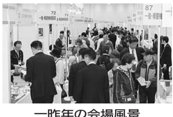
一 昨年の会場風景