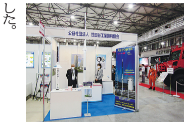
出展ブースの様子

世田谷工業振興協会は10月21日〜23日の3日間、東京ビッグサイトで開催された「危機管理産業展2020」に出展した。